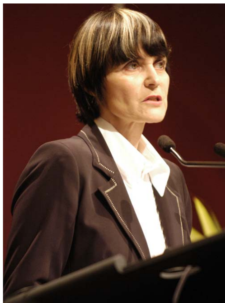
Sra. Micheline Calmy-Rey, Ministra de Asuntos Exteriores

La ministra exhortó a los delegados a centrarse únicamente en las preocupaciones