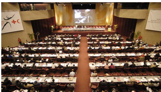
Centro de Conferencias

En cuanto a las medidas de acceso y prioridad de paso tomadas por las autoridades israelíes, gracias a los esfuerzos de la MDA, el cuadro no era homogéneo porque en algunos sitios funcionaban bastante bien y en otros subsistían problemas.