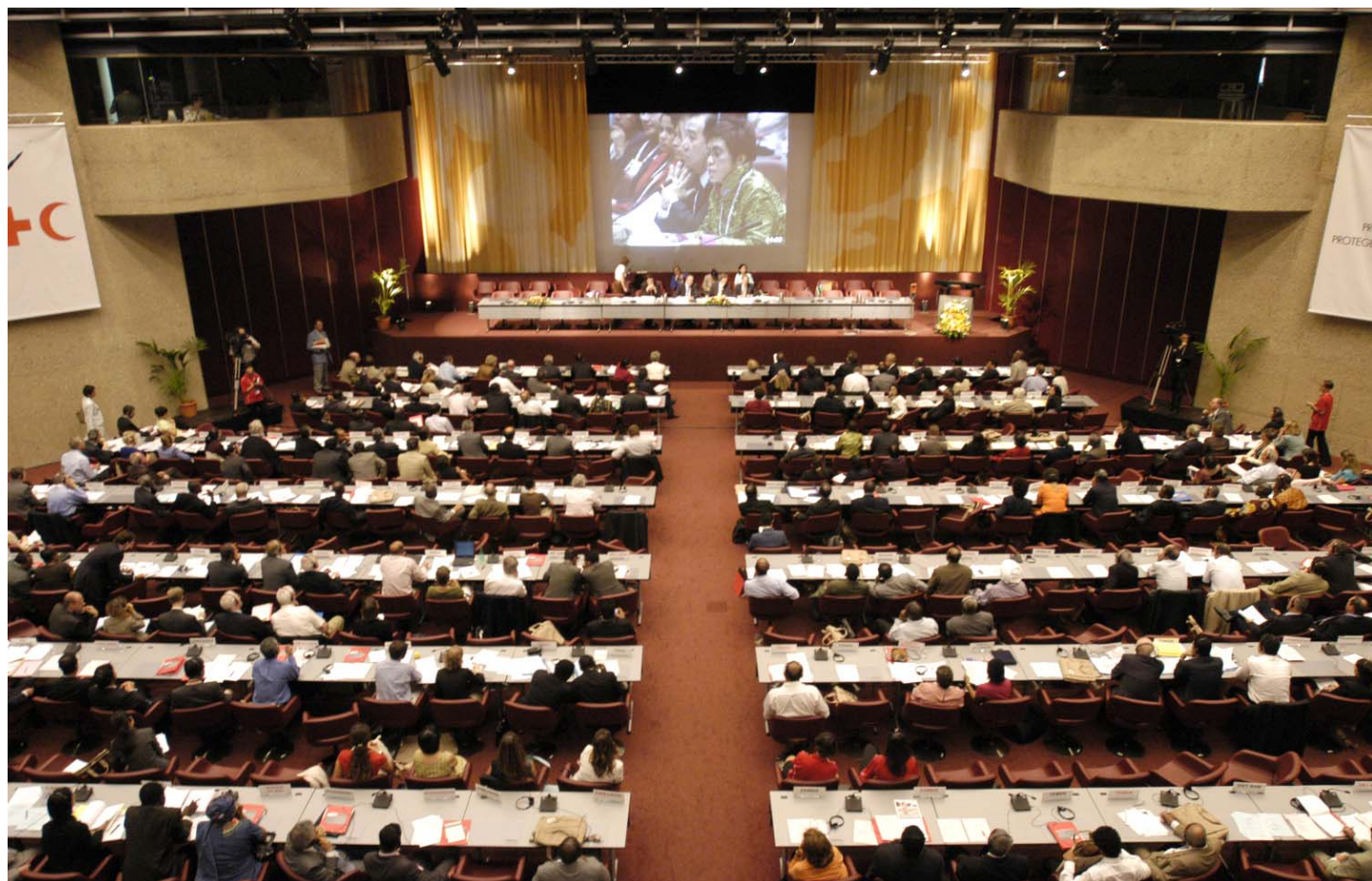
Jorge Pérez/Federación Internacional

E l Embajador Philippe Cuvillier dijo que el Movimiento debe permanecer unido en los esfuerzos para enmendar los Estatutos y adoptar la resolución.